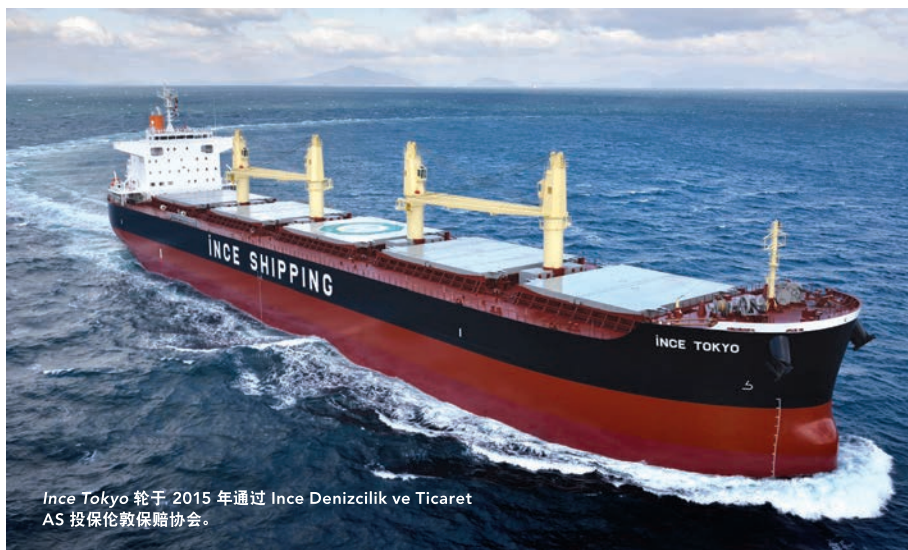
Ince Tokyo 轮于 2015 年通过 Ince Denizcilik ve Ticaret AS 投保伦敦保赔协会。

与此同时，我们于六月中旬发布了协会2016年度报告。在财务方面，报告指出2015/16年度投资环境颇为严峻，但承保表现势态良好，该年度总盈余达叁佰叁拾万美元。这使得协会的自由准备金提高到一亿陆仟零柒拾万美元——这是本协会自创会150年以来的最高纪录。在会员方面，年度报告也强调了协会在船东方面业务的增长，以及租船人业务和我们最近为船舶总吨达7,500或以下的船东推出的船东责任险项目的发展。无论在协会长期涉足的市场以及过去几年努力开拓参与的市场，我们一直乐于欢迎与新老会员的业务合作。