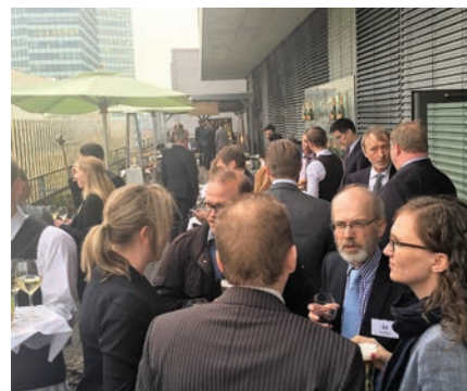
德国研讨会圆满结束，接待超过60位来宾

“协会在德国首办的研讨会出席率极佳，与我们德国团队一直以来取得的优异进展一致。从中可以看出，市场对于高质量、专业化的理赔服务的兴趣与协会跟会员的联系是紧密相关的。”